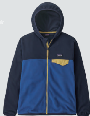
PATAGONIA K'S MICRO D SNAP-T JK

雪山に長い時間いても、あたたかく過ごすための秘訣。それがNINJA SUIT。4ウェイストレッチ生地のため着心地は抜群によく、夜は最高のパジャマにもなる。