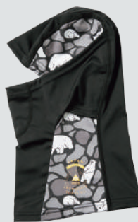
EB'S RANGER MASK JR

雪山でも街中でも活躍するシックなカラーのロールオーバーのクラシックビーニー。内側はフリースライナーで肌触りもよく保温性も高い。