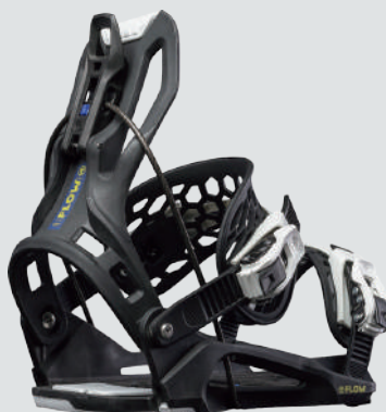
FLOW MICRON YOUTH FUSION ▷サイズ：S、M ▷カラー：BLACK ▷価格：29,700円

グロム用のSTEP ON バインディングはローライズのハイバックが特徴で、フリーライディングはもちろん、パークでもルーズなライドフィールを味わえる。4×4、3D、THE CHANNEL など主要なマウンティングシステムと互換性アリ。