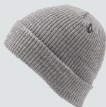
VOLCOM YOUTH LINED BEANIE

落ち着いたデザインでどんなコーデにも合わせやすく、大人用とは折り返し部分のカラーリングが逆になっている。親子コーデが面白いビーニーだ。