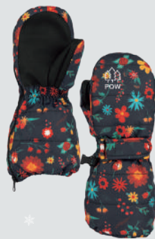
POW FIRST TURNS MITT

リサイクル素材のみを使用した完全なるサステナブルモデル。あたたかさに加えて楽しさも追求しており、多くの動物のキャラクターとカラフルな色使いのデザインにも注目だ。