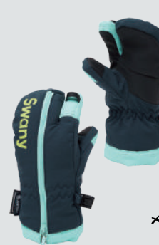
SWANY PICCOLO 3 FINGER

簡単に着脱できるようにカフから手首までジッパーを配置。肌触りのいいマイクロフリースをライナーに使用。フィット調整できるストラップが付属するなどコスバの高いミトンに仕上がった。