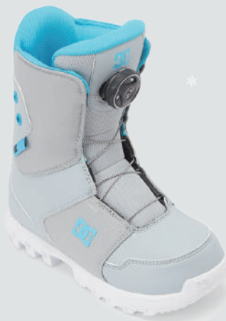
DC YOUTH SCOUT ▷サイズ：1～6 inch ▷カラー：GREY×BLUE ▷価格：25,300円

BOA フィットシステムを搭載したソフトフレックスのSTEP ON ブーツ。簡単にフィット調整できることに加え、専用バインディングとのコンビでボードの装着は一瞬で完了する。熱反射ホイルで足も冷えずに1日中快適でいられる。