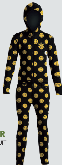
AIRBLASTER YOUTH NINJA SUIT

寒いときには吸湿して発熱、暑いときには放湿して冷却する高性能な日本製キッズ用バラクラバ。吸水速乾、静電気防止、UVカットなどの機能も完備。