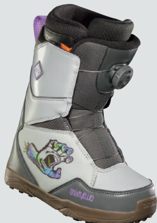
THIRTYTWO YOUTH LASHED BOA SANTA CRUZ '23 ▷サイズ：20.5～24cm ▷カラー：GREY×GUM ▷価格：37,400円

簡単に確実なホールドを提供するBOA フィットシステムを搭載。そして、ユースに適したフレックス設定、ユースのブーツには珍しい独立型のアウターとライナーを採用。最適なフィットを求めるならライナーは熱成型するのがオススメ。