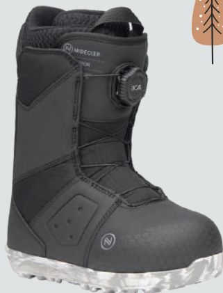
NIDECKER MICRON BOA ▷サイズ：18～25cm ▷カラー：BLACK ▷価格：41,800円

子供だけでも締めやすく、親もフィット調整のサポートをしやすいBOA フィットシステムを搭載し、成長を続けるキッズのためにサイズ調整可能なGROW インソールが採用されたモデル。最高に楽しい1日は最高のフィット感から！