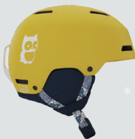
GIRO CRUE ▷サイズ：S (52～55.5cm)、M (55.5～59cm) ▷カラー：NAUMK SUNFLOWER ▷価格：14,300円

ストライダーや自転車、スケートボードなどオフシーズンに大活躍するBERNのキッズヘルメットのベストセラーモデル。別売りの専用フリースセットを装着することでウインタースポーツ仕様に！