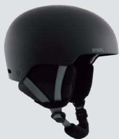
ANON KIDS' RIME 3 ▷サイズ：S/M、L/XL ▷カラー：BLACK ▷価格：13,200円

安全なライディングに欠かせない重要アイテム。大切な頭を守るヘルメットは、かぶるのが当たり前！