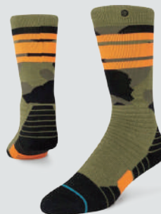
STANCE SARGENT KIDS

保温性と速乾性を備えたりサイクルポリエステル100%のマイクロフリース。フィット感のいいフード、利便性の高いポケット、冷気を防ぐ裾や袖口の縁取りなど着心地も使い勝手もピカイチだ。