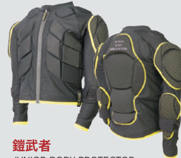
鎧武者 JUNIOR BODY PROTECTOR

パーツの組み替えで、成長の早い子供の身体に常にフィットする画期的システムを採用した、ジュニアのMからLサイズ対応プロテクター。腕のジョイントジッパーを外せばベストに早変わり。