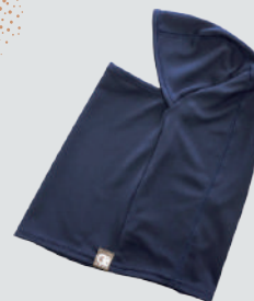
LADE.SNOW LADE BALACLAVA KIDS

吸汗速乾に優れたジュニア用バラクラバ。口元は立体成型のためアゴまで下げられ、口元内側には抗菌・抗ウイルス加工が施されている。