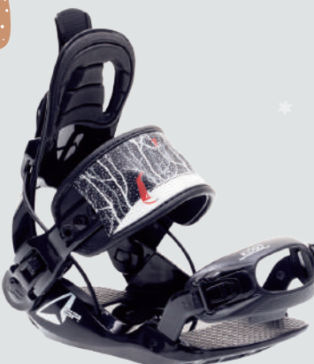
SP KIDDO ▷サイズ：XS ▷カラー：BLACK ▷価格：24,200円

ポリカーボネート製のベースに、アルミニウムのヒールカップを組み合わせた、大人用モデルと同等のハイエンドなテクノロジーが詰まったハイパフォーマンスモデル。軽さ、スムーズさ、レスポンスのよさ、どれも抜群だ。