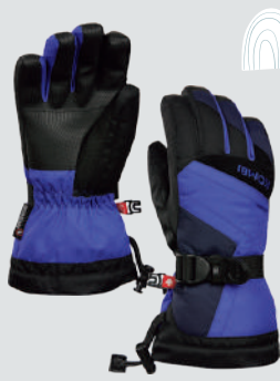
KOMBI ORIGINAL JR GLOVE

手のひらや保温素材にリサイクルポリエステルを使用した環境にやさしく財布にもやさしいグローブ。子供でも簡単に片手で操作可能なクローゼージャーやヒートポケット内蔵など機能も充実。