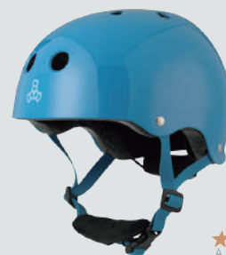
TRIPLE 8 T8 LIL 8 YOUTH ▷サイズ：0/S (46～52cm) ▷カラー：BLUE GROSSY ▷価格：8,250円

カラーによってはコースのXSというサイズ展開もあるZOOM JR.のアップグレード版。高い安全性に加えて、超軽量構造やベンチレーション機能といった多彩な機能が着用時のストレスを軽減する。