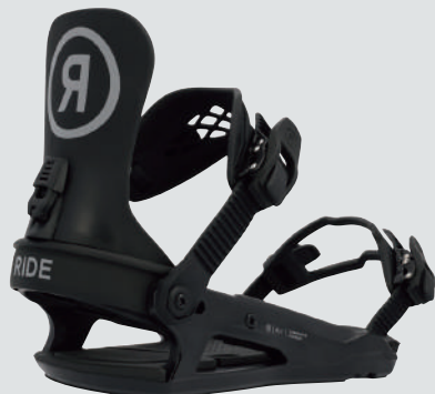
RIDE K-1 ▷サイズ：S、M ▷カラー：BLACK ▷価格：38,500円

脱着が簡単かつスピーディなリアエントリーで、パワー伝達にもサポート力にも優れたモデル。一体型 FUSION ストラップはクイックなレスポンスと包み込むようなホールド感を両立。未来のオリンピックにぜひ使ってもらいたい。