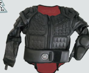
YOROI YOROI WAKA POWER VESJACK II

▷サイズ：JR FREE (JM、JL) ▷カラー：NJB ▷価格：33,940円