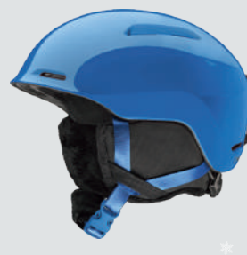
SMITH GLIDE JR. ▷サイズ：YS (51～55cm)、YM (55～59cm) ▷カラー：COBALT ▷価格：17,600円

クールなスケートスタイルデザインが特徴のCRUEは、耐久性のあるハードシェル構造、十分な通気性、インフォームフィットシステムなどにより、スマートなルックスと安全性を兼ね備えている。