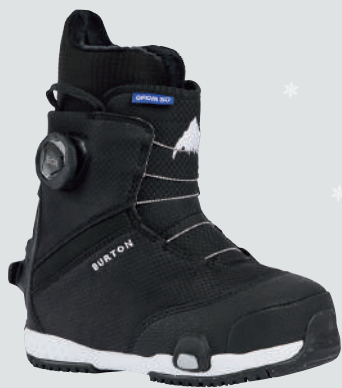
BURTON KIDS' GROM STEP ON ▷サイズ：17～21cm ▷カラー：BLACK ▷価格：30,800円

足に合った適正サイズがやっぱり滑りやすい。成長を考慮した大きすぎるサイズは避けること。