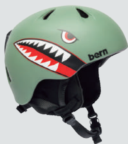
BERN NINO+KIDS KNIT FLEECE SET ▷サイズ：S/M ▷カラー：MATTE MOSS GREEN FLYING TIGER ▷価格：11,000円（フリースセットは6,600円）

ライナーとイヤerpッドが取り外せるオールシーズン対応のハードシェルモデル。FIDLOCKバックルはグローブを着けたままでも片手で操作でき、空気の流れを確保する通気チャンネルでムレ知らず。