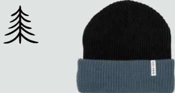
AUTUMN BLOCKED YOUTH