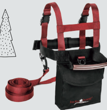
LUCKY BUMS SKI TRAINER

カカトのフィット感をアップする設計、疲労軽減を促すアーチサポート、吸汗速乾などキッズのパフォーマンスを最大限に引き出すスノーボード専用ソックス。