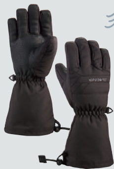
DAKINE YUKON GLOVE

手が濡れたりムレたりして気持ち悪い。指先が冷たくて痛い。それらにサヨナラするオススメのグローブ。