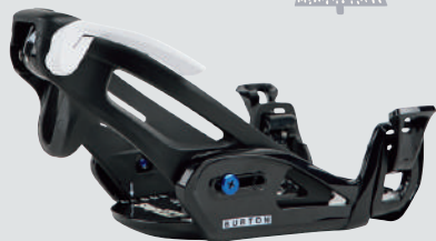
BURTON KIDS' STEP ON GROM ▷サイズ：M ▷カラー：BLACK ▷価格：24,200円

目指しているスタイルに合うモデルであることはもちろん、ブーツとの相性も必ずチェックして選ぼう。